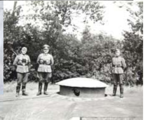
Foto's op en rond fort in 1916 (links), Duitsers in 1942 (rechts). Graffiti in het fort begin 20 e eeuw (midden), huidige toegang (boven)